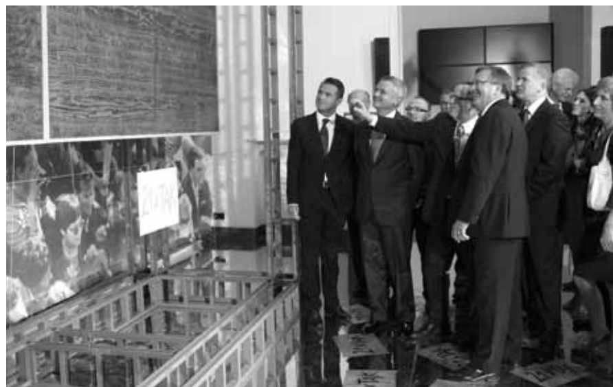
Prezydent Bronisław Komorowski zwiedza wystawę „21 x TAK” w Kordegardzie.

Wystawa została zorganizowana z inicjatywy prezydenta RP Bronisława Komorowskiego we współpracy z Ministerstwem Kultury i Dziedzictwa Narodowego, Narodowym Centrum Kultury, Europejskim Centrum Solidarności oraz Centralnym Muzeum Morskim. Mecenasem wystawy było PZU SA.