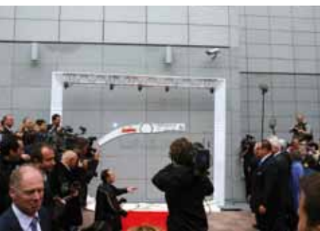
Uroczystość w Brukseli.

Promenada przy Parlamencie Europejskim w Brukseli otrzymała nazwę Solidarności '80. Esplanada – bo tak nazywana jest szeroka ulica z alejami spacerowymi – zyskała nazwę dzięki inicjatywie eurodeputowanego Jacka Saryusza-Wolskiego oraz szefa PE Jerzego Buzka. Uroczystość nadania nazwy miała miejsce 30 sierpnia 2011 roku.